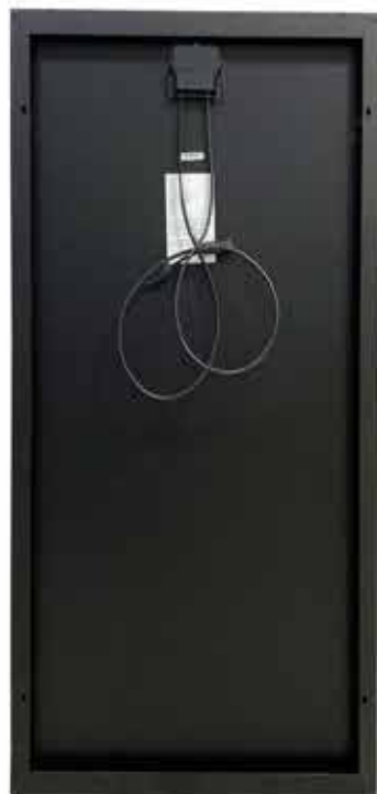
1st year -1%, 0.4% power degradation per year from 2 to 30 years